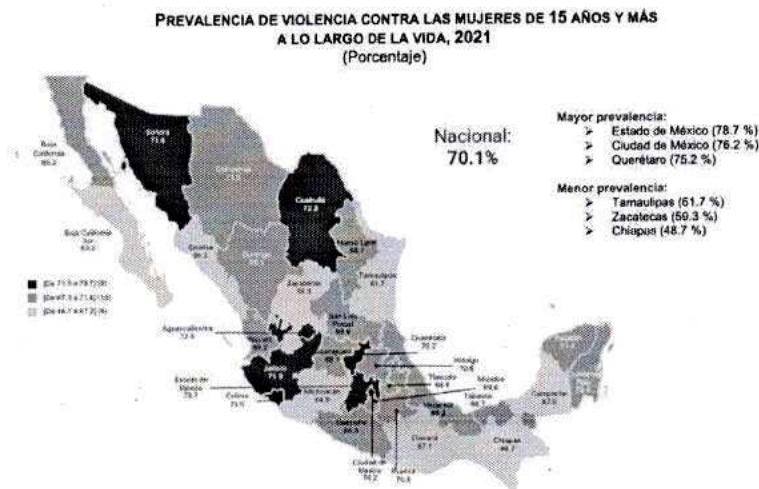
Prevalencia de violencia contra las mujeres

De acuerdo con el INEGI, en 2021, a nivel nacional, del total de mujeres de 15 años y más, 70.1 % han experimentado al menos un incidente de violencia, que puede ser psicológica, económica, patrimonial, física, sexual o discriminación en al menos un ámbito y ejercida por cualquier persona agresora a lo largo de su vida. La violencia psicológica es la que presenta mayor prevalencia (51.6 %), seguida de la violencia sexual (49.7 %), la violencia física (34.7 %) y la violencia económica, patrimonial y/o discriminación (27.4 %). 294